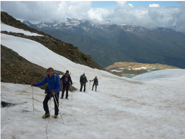
Hochtour Ortler Köllspitze