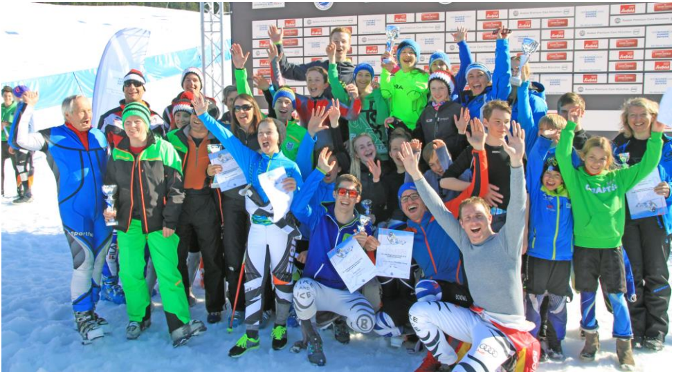
Das Foto zeigt die Landkreismannschaft, die beim Regionalcupfinale 2016 in Seefeld Platz 3 erreichte.