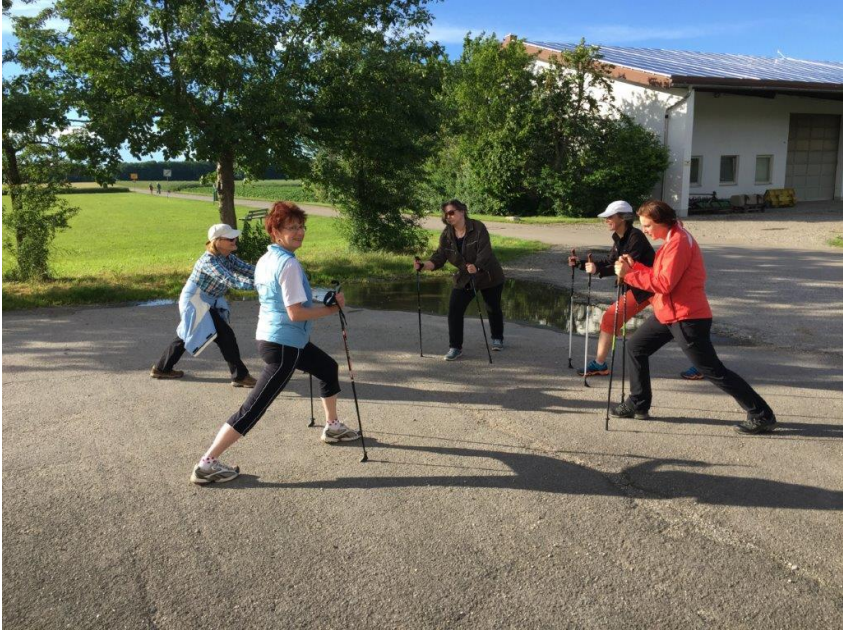
Aufwärmen ist wichtig