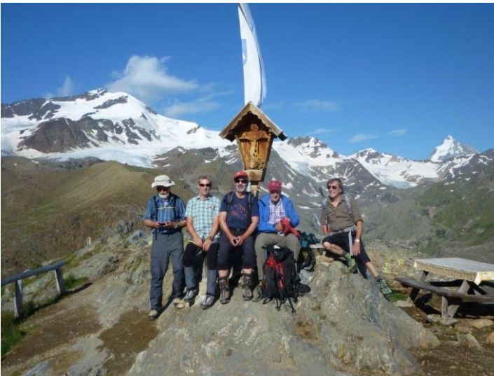
Marteller Hütte Panoramablick