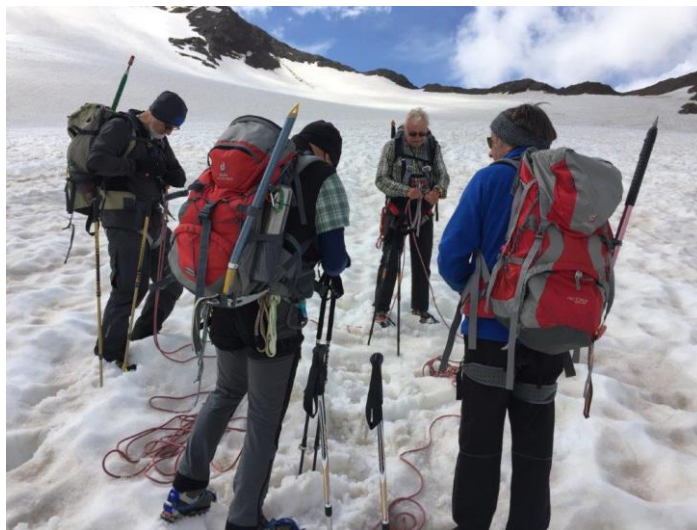
Hohenferner Köllkuppe (3330m)