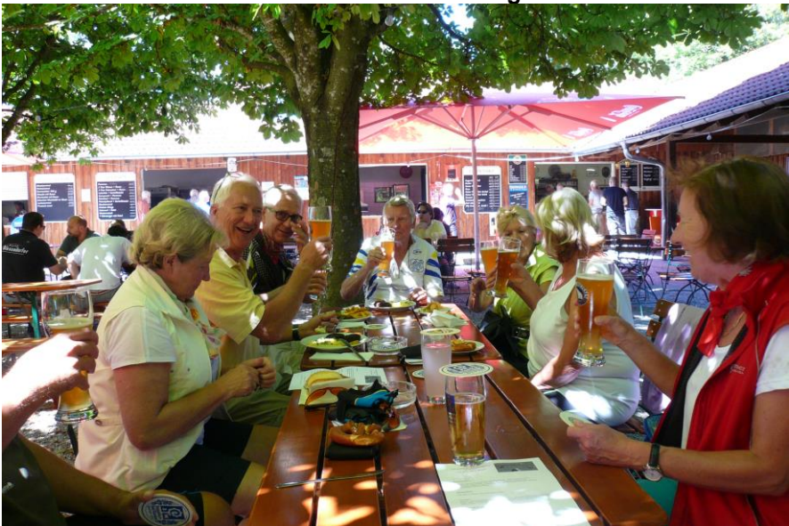
Montagsradler im Biergarten