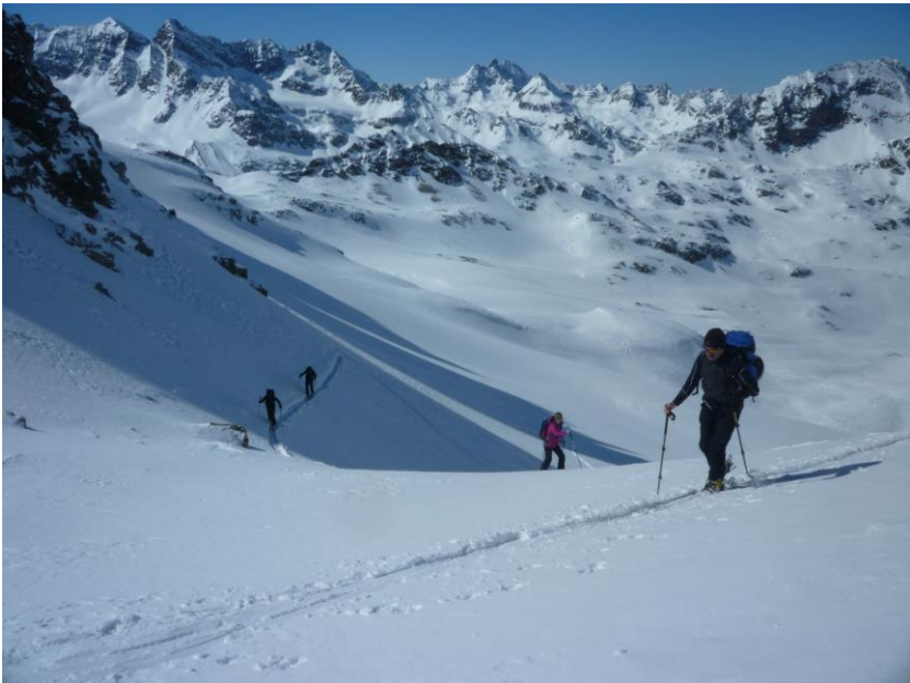
Skitourenwoche Silvretta März 2016