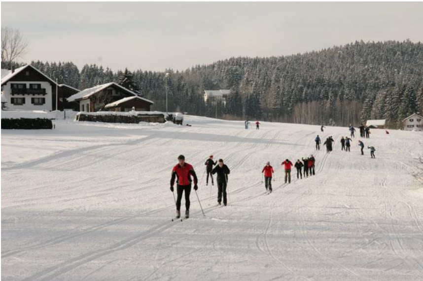
Skistadion Reit im Winkl