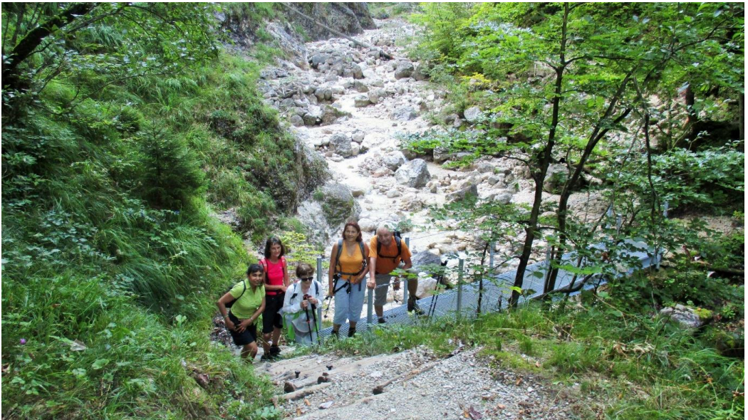
Wandern bergauf am Predigtstuhl