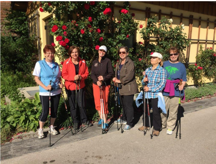
Nordic Walking Treffpunkt Hausen

Gewerbestraße 3 85652 Landsham Telefon 089/9034646 Telefax 089/9045303 E-mail: Schreinerei-Prasch@web.de