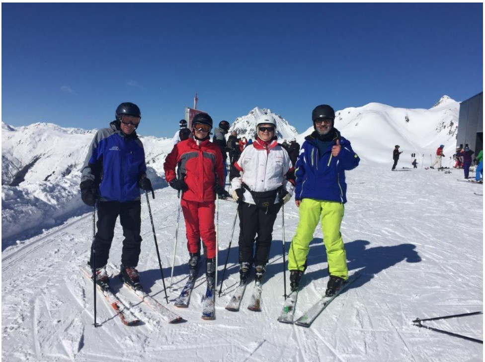
Skifahrt nach Kirchberg-Kitzbühl

Auskunft und Anmeldung bis jeweils zwei Tage vor der Fahrt!