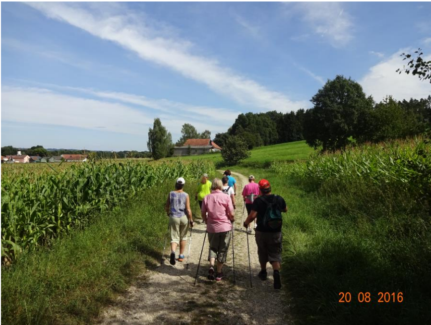
Nordic Walking in Niederbayern