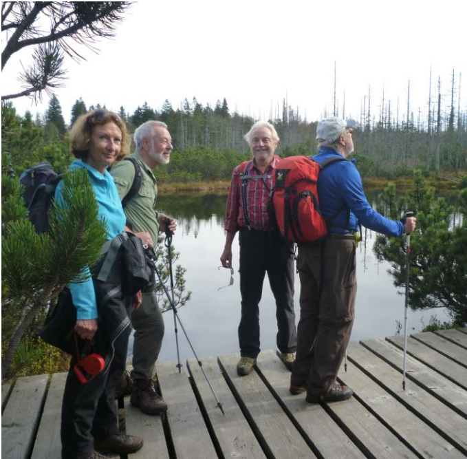
Wandertage Bayerischer Wald